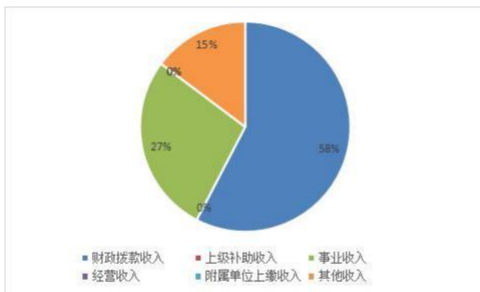
图 2: 收入决算结构