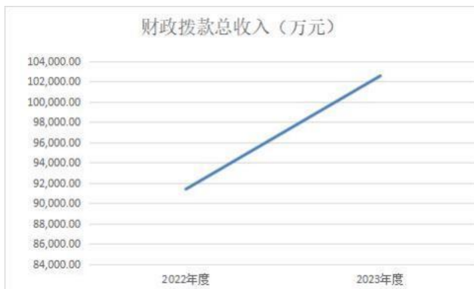
图 4: 财政拨款收、支决算总计变动情况